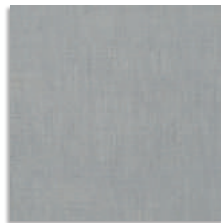
Moribana Gris G.143