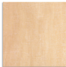
Lino Ocre G.127