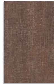
Loom Marrón G.212