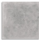
Orchard Cemento G.179 Antideslizante G.179