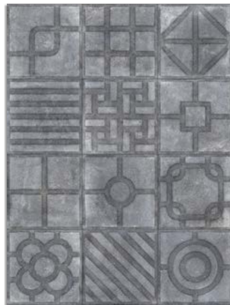
* Paulista Grafito G.179