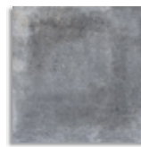
Orchard Grafito G.179 Antideslizante G.179