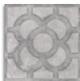
Acorn Cemento G.179 Antideslizante G.179