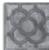
Acorn Grafito G.179 Antideslizante G.179