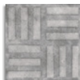
Norvins Cemento G.179 Antideslizante G.179