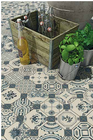
'Atlas' čini zanimljiv kolaž grafičkih uzoraka i tradicionalnih motiva

Htjeli-ne htjeli, uskoro će vas uhvatiti proljetno ludilo, poželite ćete nakon temeljitog ribanja i osvježiti malo svoj prostor, promijeniti koji prekrivač, uzeti kakvi buketić, nabaviti nove ukrasne jastučiće... Stan će napokon biti ko bonbončić, al' ćete zato i biti preumorni za one ugodne i te i prodvećerija pićenca s prijateljima.