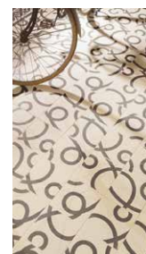
'Art Nouveau' podne obloge krasi moderan izgled