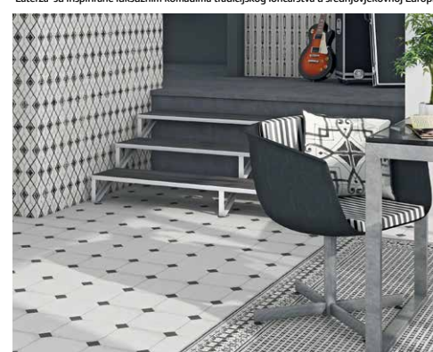
Bezvremenska sofisticiranost kontrasta crnih i bijelih pločica u 'Maison Bohème' kolekciji stvorit će homogeni scenarij koji ima ulogu naglasiti prisutnost drugih elemenata dekora ili namještaja

'Boulevard' linija nudi zanimljive 'patchwork' uzorke s brojnim mogućnostima kombiniranja