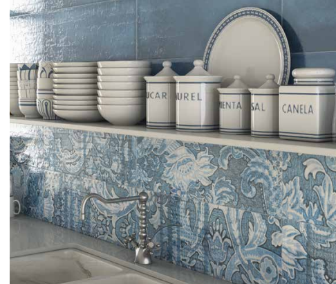
'Laterza' su inspirirane luksuznim komadima tradicijskog lončarstva u srednjovjekovnoj Europi