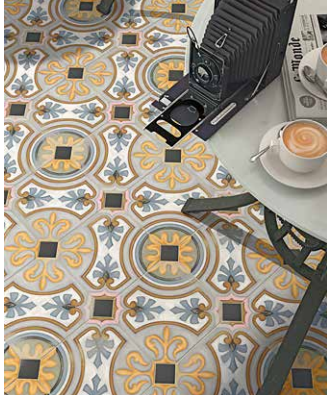
'Vodevil' su nadahnute zlatnim godinama francuskog impresionizma sa suptilnim primjesama viktorijanskog stila