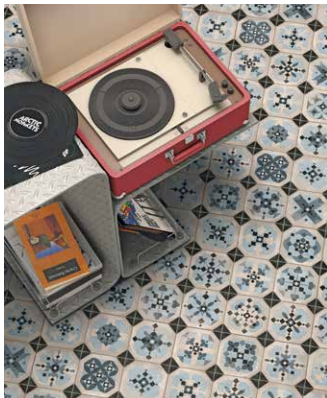
'World Parks' dio su 'Atlas' kolekcije u kojoj je svaki od sedam dizajna dobio ime po jednom od najpoznatijih svjetskih parkova

Španjolska tvrtka 'Vives Cerámica' poznata je po 'patchwork' uzorku inspiriranom tradicionalnim pločicama iz Valencije i lokalnom običaju oblaganja površina korištenjem ostataka različitih veličina i motiva