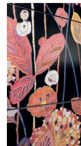
Impresivne 'Satinados' pločice s floralnim motivima i diskretnim reljefnim detaljima

Godine 2003. predstavili su "patchwork" inspiriran tradicionalnim pločicama iz Valencije i uobičajenom lokalnom običaju oblaganja površina korištenjem ostataka različitih veličina i motiva. Ovaj neobičan i slučajni sklad u primjeni i dizajnu nadahnulo je posebne komade koje su izradili u ovoj španjolskoj kompaniji, pa je danas nakon više od desetljeća naizgled spontani i nasumičan koncept stvorio poseban trend u svijetu keramike i uređenja interijera.