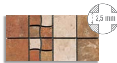
(*) Composición Gres-121 12,5x25 aprox. G.61