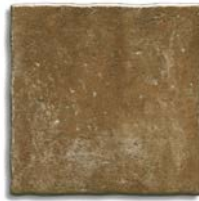
Ánfora Tierra G.210