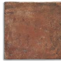
Ánfora Cuero G.210