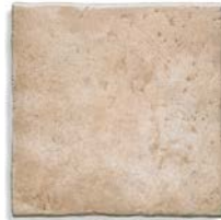
Ánfora Beige G.210