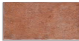
Ánfora Cuero G.136

RODAPIÉ SKIRTING TILE 10x40 cm. / 3.9x15.7 inches Ánfora G.28 9x25 cm. / 3.5x9.8 inches Ánfora G.19