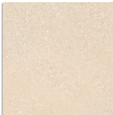
Beta Beige G.229