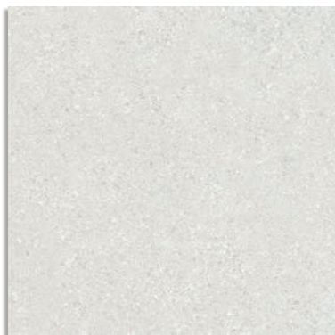
Beta Light G.229