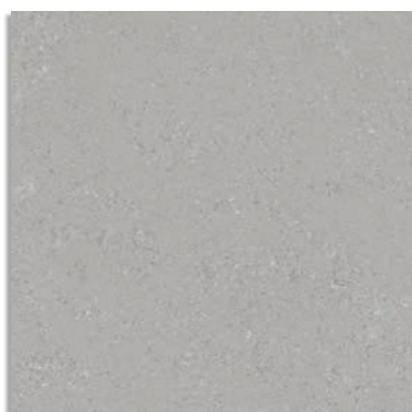
Beta Cemento G.229