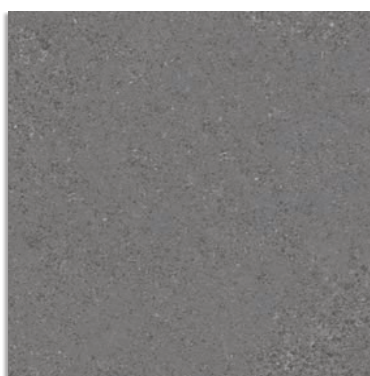
Beta Plomo G.229