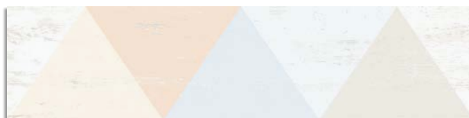
(3) Caria-R Blanco G.168