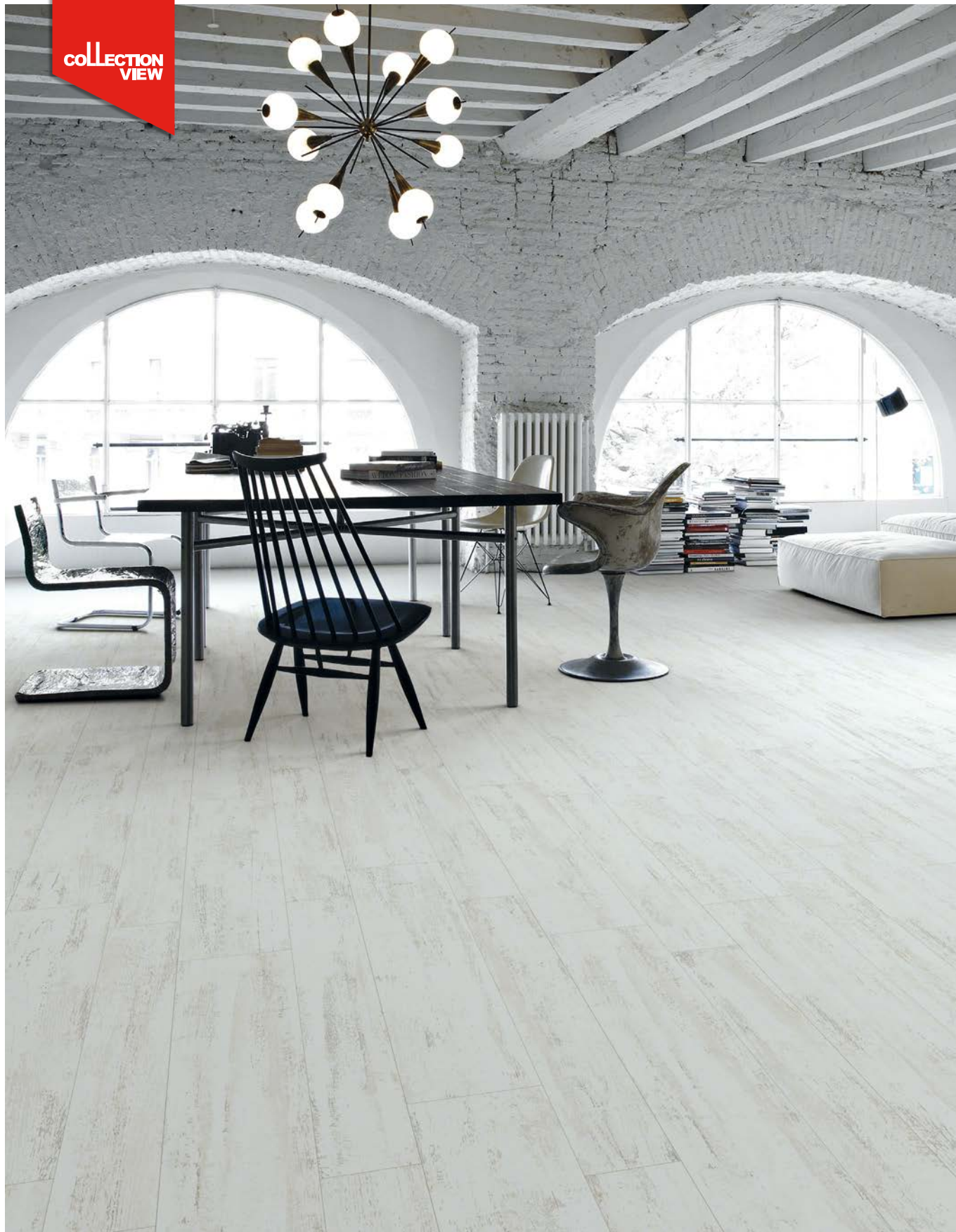
Efeso-R Blanco - 14,4x89,3 cm. / 21,8x89,3 cm.