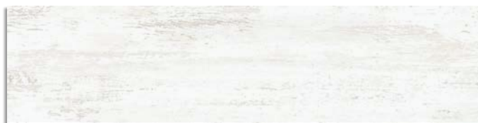
Efeso-R Blanco G.168