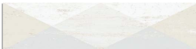
(2) Dion-R Blanco G.168