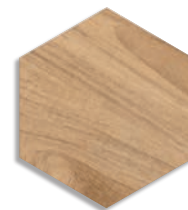
Hexágono Gamma Miel G.161

ANTIDESLIZANTE. Con el fin de dar una mayor seguridad en aquellas áreas transitables, cuyas condiciones de humedad y pendientes son mayores de lo habitual, hemos realizado las pruebas de ensayo según las normas: UNE 41901:2017 EX, UNE 41902:2017 EX, DIN 51130, DIN 51097, DCOF, BS 7976-2:2002. Para más información, consultar nuestro departamento técnico.