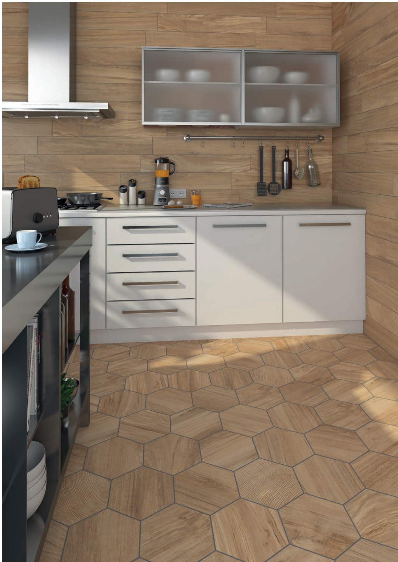
Gamma-R Miel · 14,4x89,3 cm. / Hexágono Gamma Miel · 23 x26,6 cm.