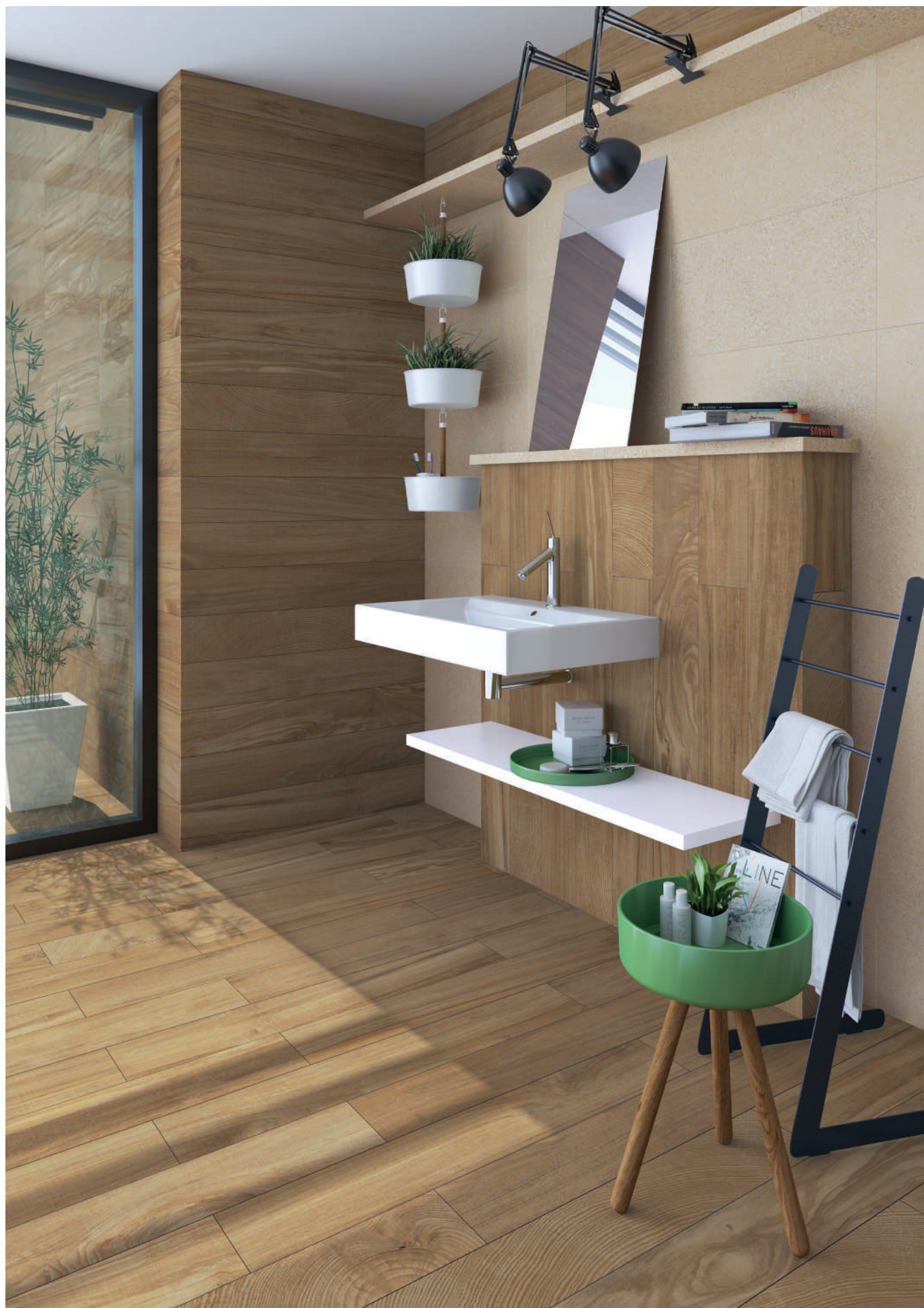
Gamma-R Miel - 14,4x89,3 cm. / Alpha-R Beige - 29,3x59,3 cm.