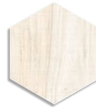
Hexágono Gamma Blanco G.161