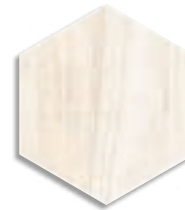
Hexágono Gamma Blanco G.203