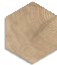
Hexágono Gamma Beige G.203