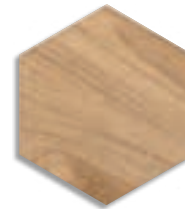
Hexágono Gamma Miel G.203

ANTIDESLIZANTE. Con el fin de dar una mayor seguridad en aquellas áreas transitables, cuyas condiciones de humedad y pendientes son mayores de lo habitual, hemos realizado las pruebas de ensayo según las normas: UNE 41901:2017 EX, UNE 41902:2017 EX, DIN 51130, DIN 51097, DCOF, BS 7976-2:2002. Para más información, consultar nuestro departamento técnico.