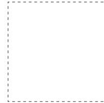
80x80 cm. 31.5x31.5 inches Inari-R G.203