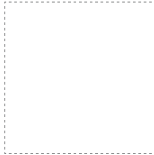
120x120 cm. 47.2x47.2 inches Inari-R G.206