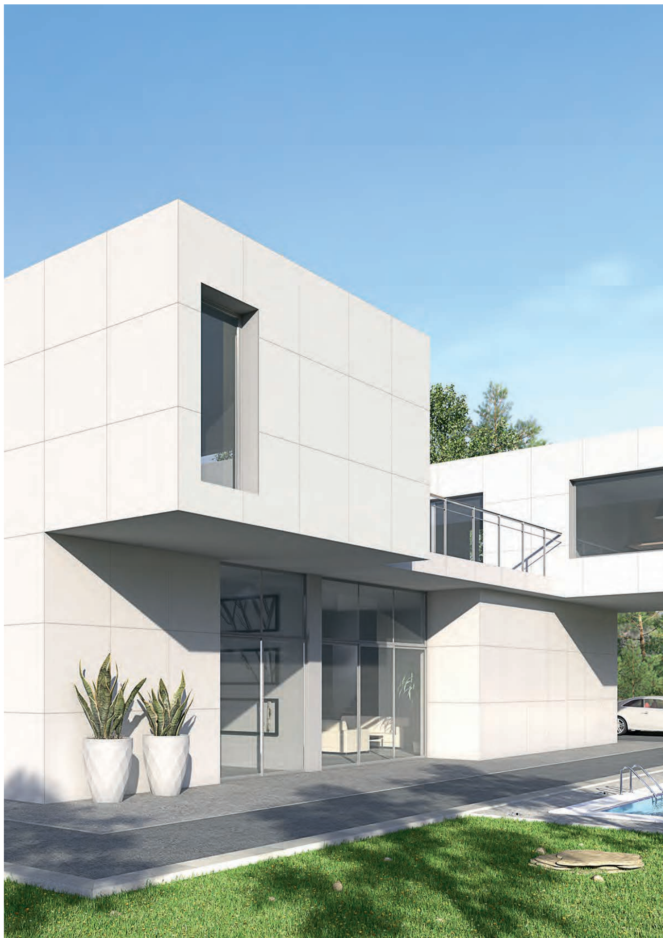
Inari-R Nieve · 120x120 cm. / Ceppo di Gre - R Cemento · 120x120 cm.