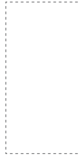
60x120 cm. 23.6x47.2 inches Inari-R G.168