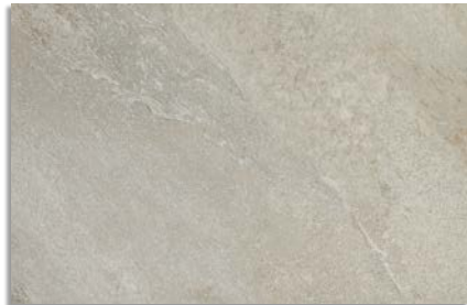
Narpes Natural G.192