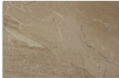
Narpes Tierra G.192