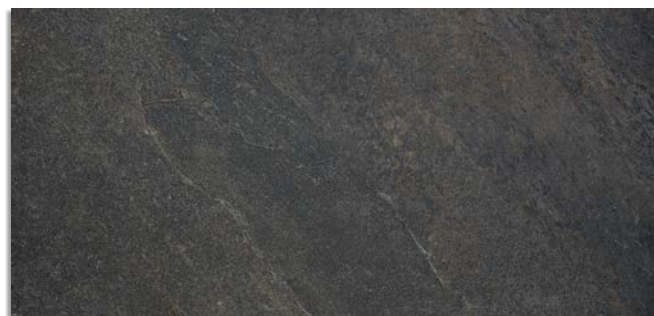
Narpes-R Negro G.196