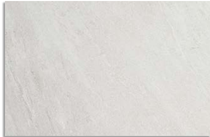
Narpes Blanco G.192