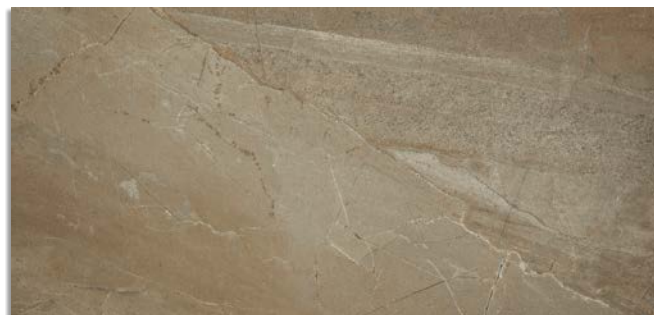
Narpes-R Tierra G.196