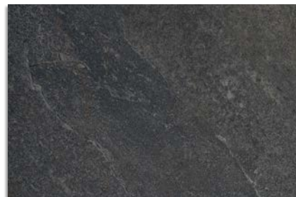
Narpes Negro G.192