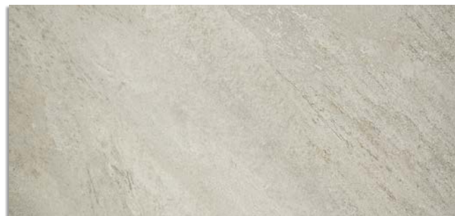
Narpes-R Natural G.196