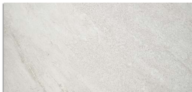
Narpes-R Blanco G.196