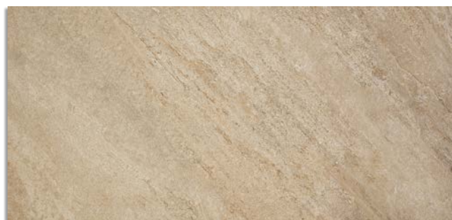
Narpes-R Beige G.196