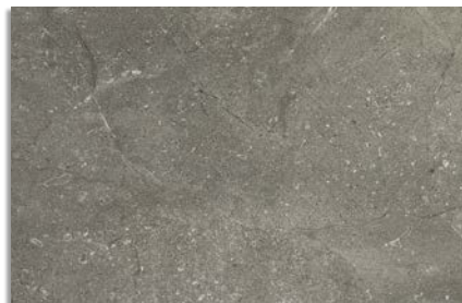
Narpes Antracita G.192