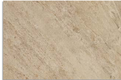
Narpes Beige G.192