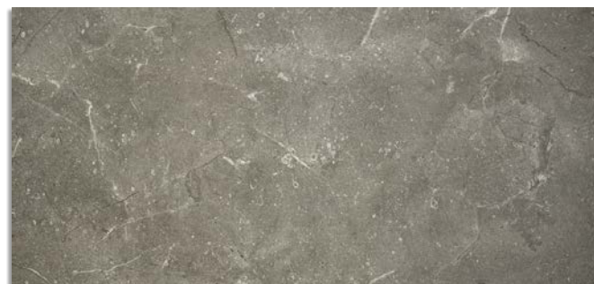
Narpes-R Antracita G.196