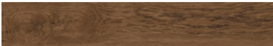
Ottawa-R Marrón G.172