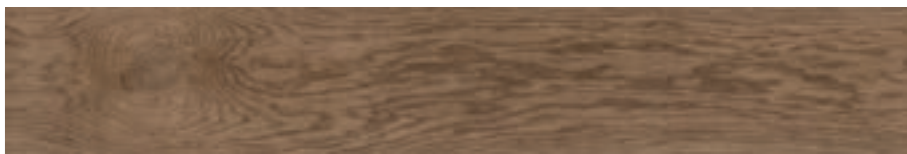
Ottawa-R Miel G.172