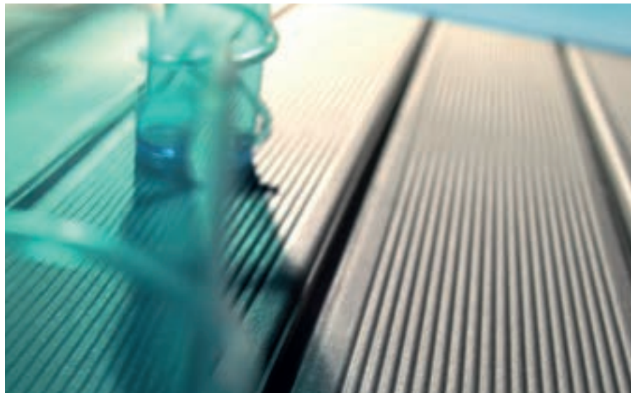
Moorea-R Blanco · 14,3x119,3 cm.