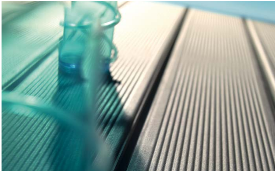
Moorea-R Blanco · 14,3x119,3 cm.