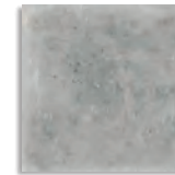
Orchard Cemento G.179 Antideslizante G.179