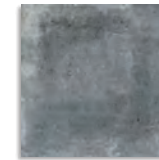
Orchard Grafito G.179 Antideslizante G.179