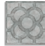
Acorn Cemento G.179 Antideslizante G.179