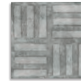
Norvins Cemento G.179 Antideslizante G.179