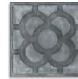
Acorn Grafito G.179 Antideslizante G.179