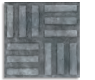
Norvins Grafito G.179 Antideslizante G.179