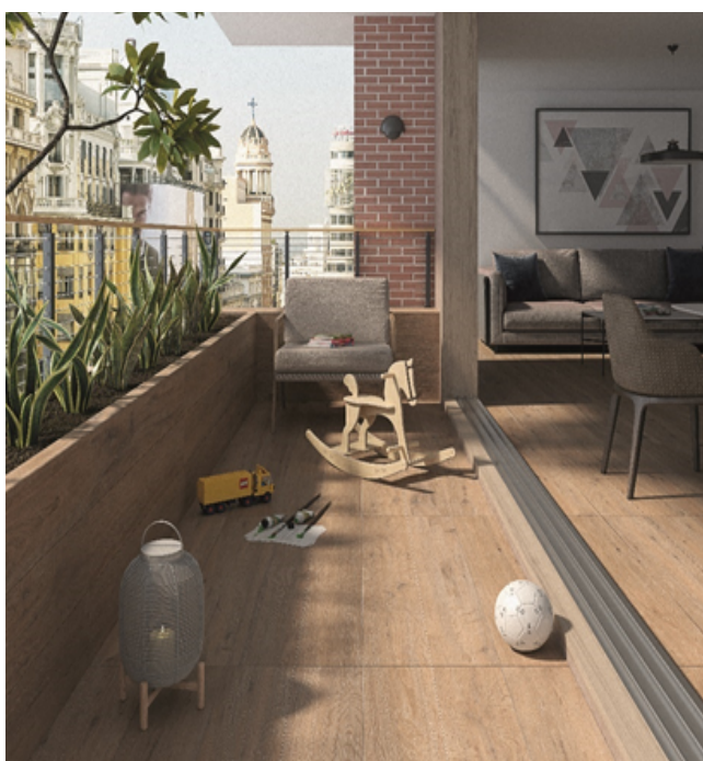
Figura 1 Producto instalado