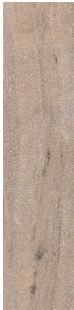
Figura 4 Imagen de una baldosa de gres porcelánico