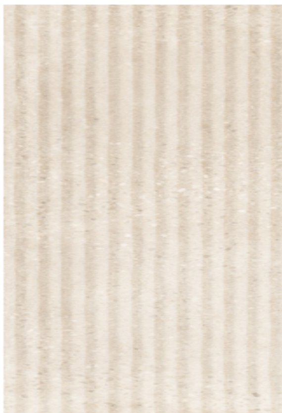
Figura 3 Imagen de una baldosa de azulejo

Los residuos derivados del embalaje de las piezas son gestionados de manera separada en función de la localización geográfica del lugar de instalación. Por otra parte, se ha considerado un 3% de pérdidas de producto en la etapa de instalación de las baldosas.