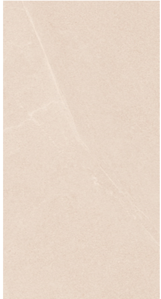
Figura 4 Imagen de una baldosa de azulejo