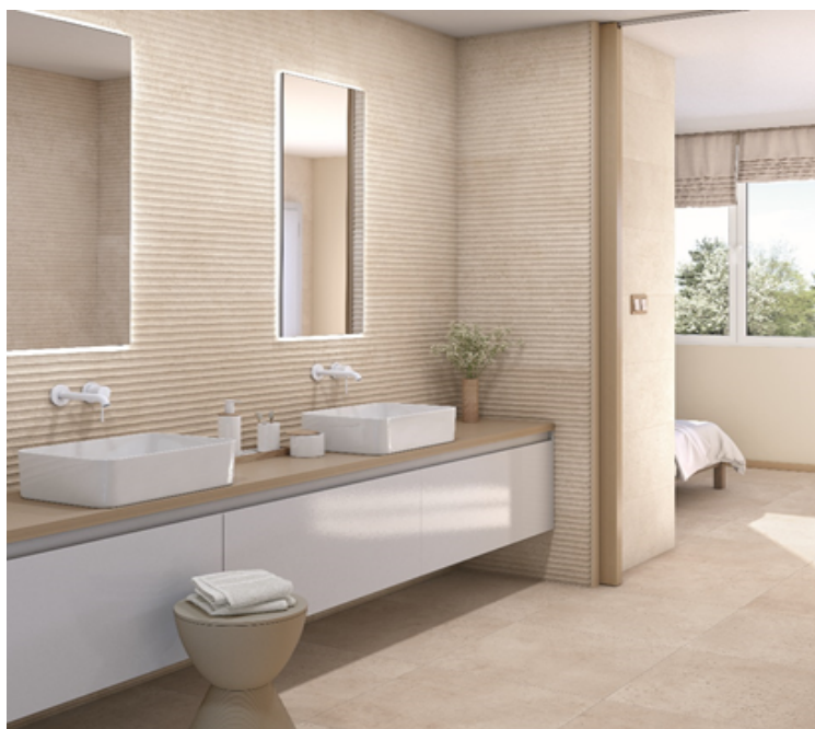
Figura 1 Producto instalado